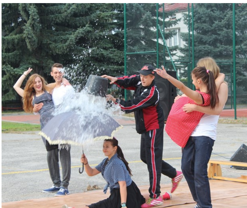
Po energetyzującym tańcu... niespodziewany przysznic!