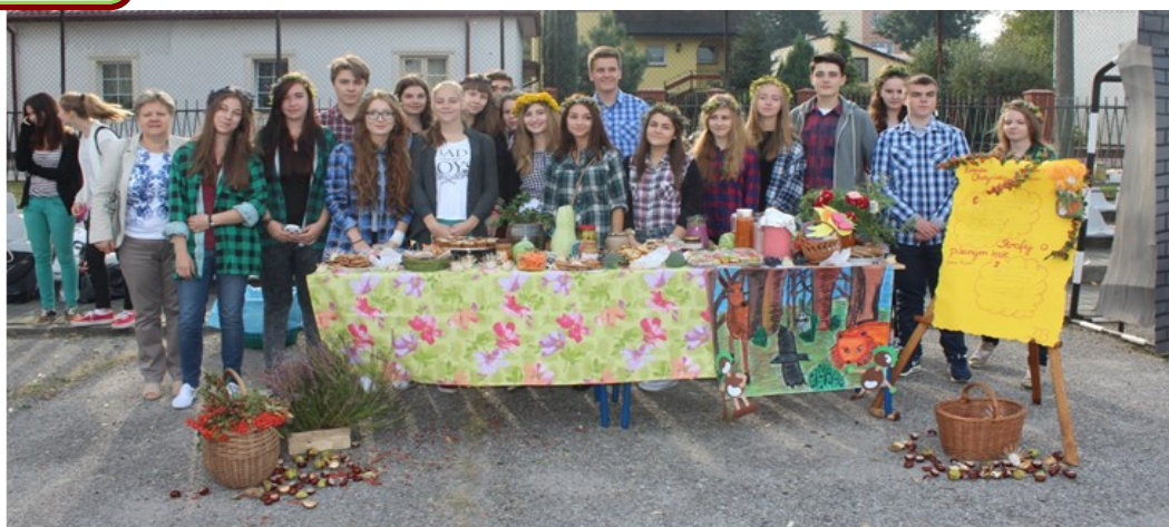
Kraciasta I b – niby nowicjusze, a III miejsce zdobyli.